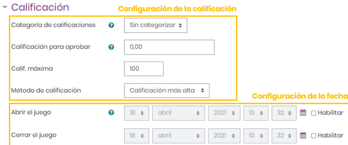
Imagen 4: Configuración de la calificación y la fecha

En el espacio de Calificación, se puede anotar la calificación máxima que se concederá a esta actividad, también se puede seleccionar la fecha y hora de inicio, así como la fecha de hora y cierre de la misma.