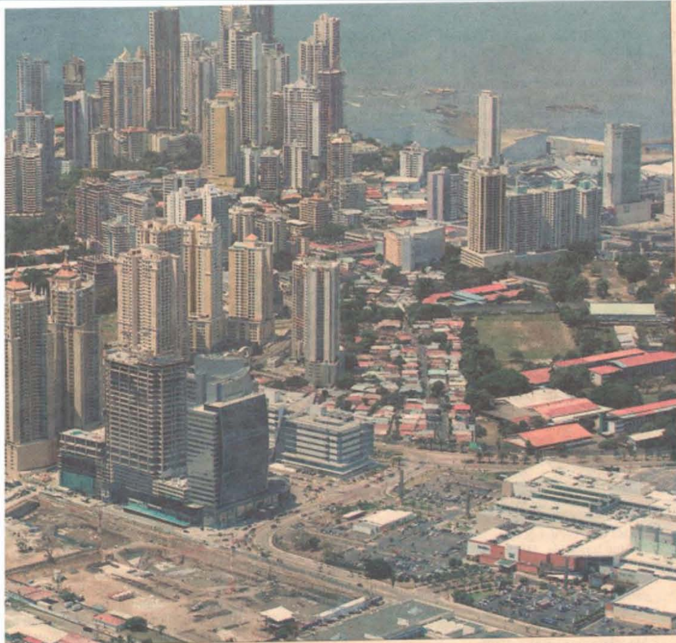
La ciudad de Panamá está en plena transformación. En la imagen, la zona de Punta Paitilla.

tra directa aumentó un 28% en los últimos dos años y superó los 1.000 millones de dólares, "siendo una cifra récord que nunca se había registrado en Panamá", según Quijano.