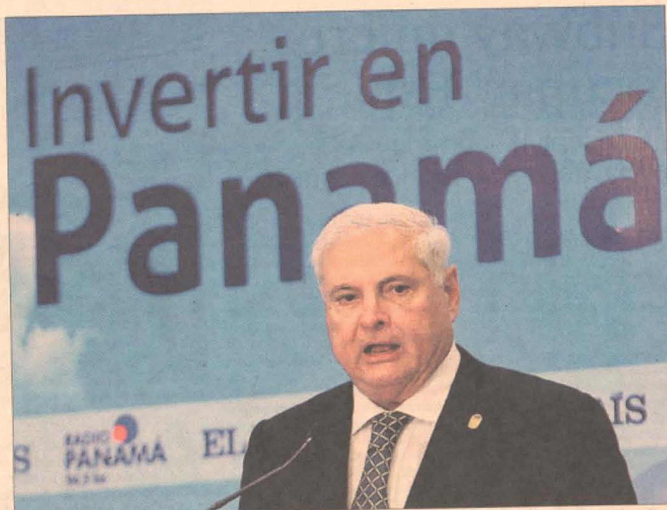
El presidente Ricardo Martinelli, durante su discurso en el foro Invertir en Panamá.