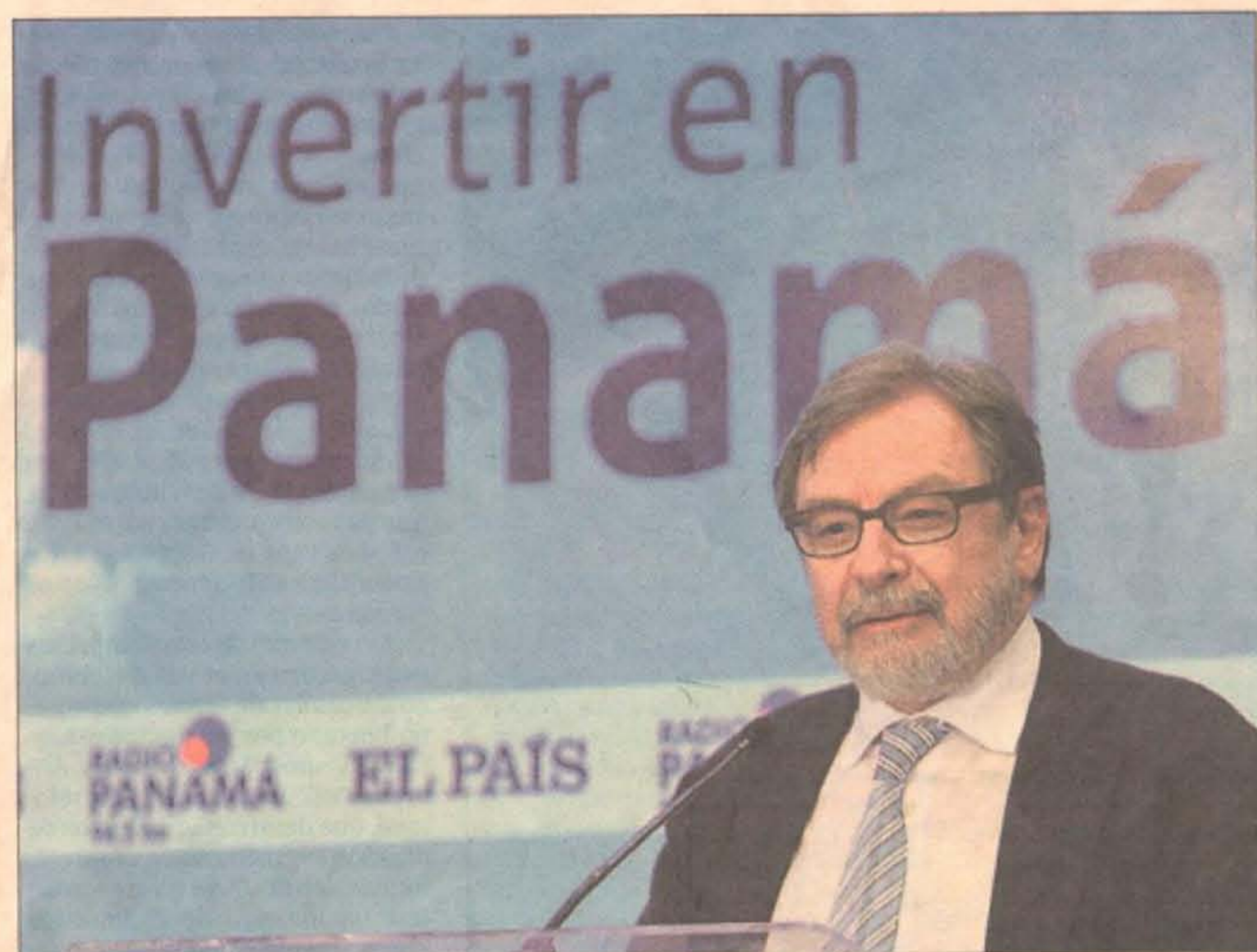
El presidente de EL PAÍS, Juan Luis Cebrían, se dirige a los asistentes al encuentro.