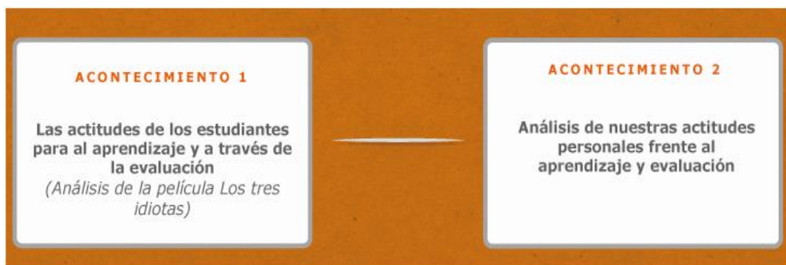
Figura 1. Acontecimientos de la UF 2. Evaluación y Aprendizaje

La Unidad Formativa se estructura en 2 acontecimientos o bloques temáticos, los cuales se ilustran en la siguiente figura.