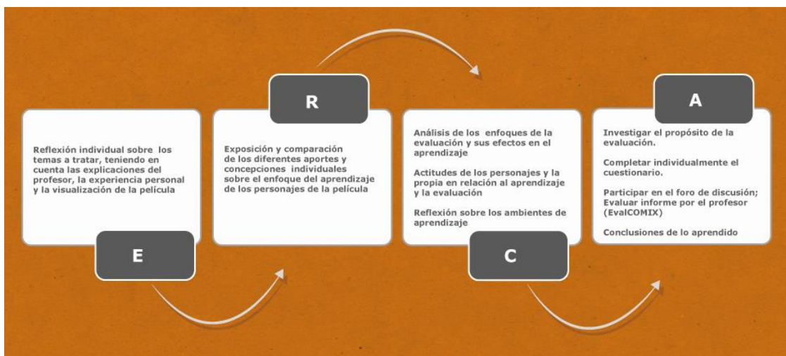
Figura 3. Secuencia de aprendizaje ERCA de los dos acontecimientos de la UF2 Evaluación y Aprendizaje

La secuencia de aprendizaje que organiza los dos acontecimientos de esta unidad formativa se centra en la Experiencia, Reflexión, Conceptualización y Acción (ERCA) de los estudiantes como se observa en la figura 3.